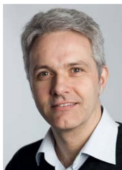
Af Morten Jakobsen, Kræftens Bekæmpelse

Hård fodboldtræning til ældre mænd, som er i kastrationsbehandling for prostatakræft. Det svarer ikke umiddelbart til billedet af en omsorgsfuld behandling. Men et rehabiliteringsforsøg, som Kræftens Bekæmpelse støtter, viser at det formentligt har kunnet øge både sundhed og livskvalitet hos mændene.