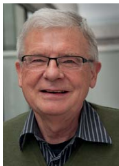
Af Paul Samsø

I 2012 blev mødet mellem de nordiske patientforeninger afholdt i København. Den 7. juni var eftermiddagen sat af til præsentationer og debat mellem foreningerne. Den 8. juni var formiddagen henlagt til Rigshospitalet med tre præsentationer fra specialister fra hospitalet.