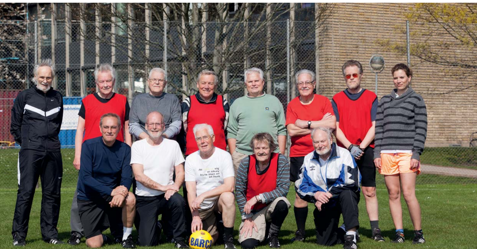
Fodboldholdet med deres træner yderst til højre

træt, min balance er blevet bedre, mit EKG er i top og jeg har ikke knogleskørhed. Jeg er bange for at få diabetes af behandlingen, så motionen er vigtig. Og så er humoren på holdet en god ting.